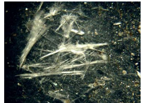
ਵਰਮੀਕੁਲਾਈਟ ਐਟਿਕ ਇਨਸੂਲੇਸ਼ਨ ਵਿੱਚ ਐਸਬੈਸਟਸ ਫ਼ਾਈਬਰ

ਤੁਸੀਂ ਇਮਾਰਤ ਦੇ ਸ਼ੱਕੀ ਹਿੱਸਿਆਂ ਦੇ ਸੈਂਪਲ ਲੈਬਾਰਟਰੀ ਵਿੱਚ ਟੈਸਟ ਲਈ ਭੇਜ ਸਕਦੇ ਹੋ। ਇਹ ਤੁਹਾਨੂੰ ਆਪਣੇ ਆਪ ਨਹੀਂ ਕਰਨਾ ਚਾਹੀਦਾ - ਬਲਕਿ ਐਸਬੈਸਟਸ ਦੇ ਖ਼ਤਰਿਆਂ ਦਾ ਮੁੱਲਾਂਕਣ ਕਰਨ ਦੀ ਯੋਗਤਾ ਪਰਾਪਤ ਕਿਸੇ ਸਰਵੇਅਰ ਜਾਂ ਸਲਾਹਕਾਰ ਕੋਲੋਂ ਨਮੂਨੇ ਇਕੱਠੇ ਕਰਵਾਉਣੇ ਚਾਹੀਦੇ ਹਨ। ਕੋਈ ਨਮੂਨਾ ਇਕੱਠਾ ਕਰਨ ਤੋਂ ਪਹਿਲਾਂ ਉਸਦੀ ਕਾਬਲੀਅਤ ਦਾ ਪਰਮਾਣ ਪਤਰ ਦੇਖੋ। ਯਾਦ ਰੱਖੋ, ਕਿ ਸਾਰੇ ਐਸਬੈਸਟਸ - ਫੁਪੇ ਐਸਬੈਸਟਸ ਸਮੇਤ - ਪਛਾਣੇ ਜਾਣੇ ਚਾਹੀਦੇ ਹਨ!