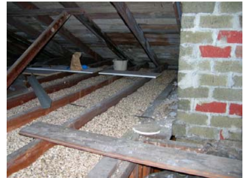
ਐਸਬੈਸਟਸ- ਵਾਲੀ ਵਰਮੀਕੁਲਾਈਟ ਐਟਿਕ ਇਨਸੂਲੇਸ਼ਨ

ਐਸਬੈਸਟਸ ਇੱਕ ਸੰਭਾਵੀ ਜਾਨ-ਲੇਵਾ ਖਣਿਜ ਹੈ ਜੋ ਬਹੁਤ ਸਖ਼ਤ ਹੈ ਅਤੇ ਰਸਾਇਣਾਂ ਅਤੇ ਗਰਮੀ ਦਾ ਇਸਤੇ ਕੋਈ ਖਾਸ ਅਸਰ ਨਹੀਂ ਹੁੰਦਾ। 1990 ਤੱਕ, ਇਸ ਨੂੰ ਆਮ ਤੌਰ ਤੇ ਛੱਤਾਂ ਦੀ ਸਜਾਵਟ, ਡਰਾਈ ਵਾਲ ਮਡ, ਫਰਸ਼ਾਂ ਅਤੇ ਐਟਿਕ ਦੀ ਇਨਸੂਲੇਸ਼ਨ ਲਈ ਵਰਤਿਆ ਜਾਂਦਾ ਸੀ। ਮੁਰੰਮਤ ਵੇਲੇ ਜਾਂ ਬਿਲਡਿੰਗ ਢਾਹਣ ਵੇਲੇ ਜੇ ਇਨ੍ਹਾਂ ਜਗ੍ਹਾਂ ਨੂੰ ਛੇੜਿਆ ਜਾਵੇ ਜਿਵੇਂ ਕਿ ਇਨ੍ਹਾਂ ਵਿੱਚ ਮੋਰੀ ਕੀਤੀ ਜਾਵੇ, ਆਰੇ ਨਾਲ ਚੀਰਿਆ ਜਾਵੇ, ਰੇਗਮਾਰ ਨਾਲ ਰਗੜਿਆ ਜਾਵੇ ਜਾਂ ਤੋੜਿਆ ਜਾਵੇ ਤਾਂ ਕਾਮੇਂ ਅਤੇ ਪਰਵਾਰ ਦੇ ਜੀਅ ਐਸਬੈਸਟਸ ਦੀ ਧੂੜ ਸਾਹ ਰਾਹੀਂ ਲੈ ਸਕਦੇ ਹਨ। ਜੇ ਕਰ ਲੋਕ ਕਾਫੀ ਐਸਬੈਸਟਸ ਫ਼ਾਈਬਰ ਸਾਹ ਰਾਹੀਂ ਅੰਦਰ ਲੰਘਾ ਲੈਂਦੇ ਹਨ ਤਾਂ ਉਨ੍ਹਾਂ ਦੇ ਫੇਫੜਿਆਂ ਨੂੰ ਪੱਕੇ ਤੌਰ ਤੇ ਨੁਕਸਾਨ ਹੋ ਸਕਦਾ ਹੈ ਅਤੇ ਫੇਫੜਿਆਂ ਦਾ ਕੈਂਸਰ ਹੋ ਸਕਦਾ ਹੈ।