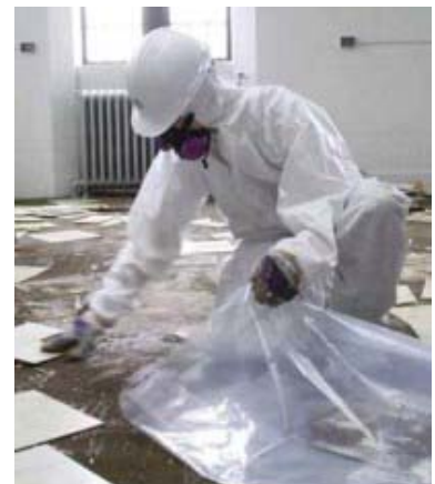
ਫਰਸ਼ ਤੋਂ ਐਸਬੈਸਟਸ ਹਟਾਉਂਦਾ ਹੋਇਆ ਸੁਰੱਖਿਅਤ ਕਾਮੇਂ

ਘਰਾਂ ਵਿੱਚ ਐਸਬੈਸਟਸ ਬਾਰੇ ਜਾਣਕਾਰੀ ਲਈ, www.worksafebc.com ਤੇ ਜਾਓ ਅਤੇ “ਐਸਬੈਸਟਸ” ਬਾਰੇ ਲੱਭੋ।